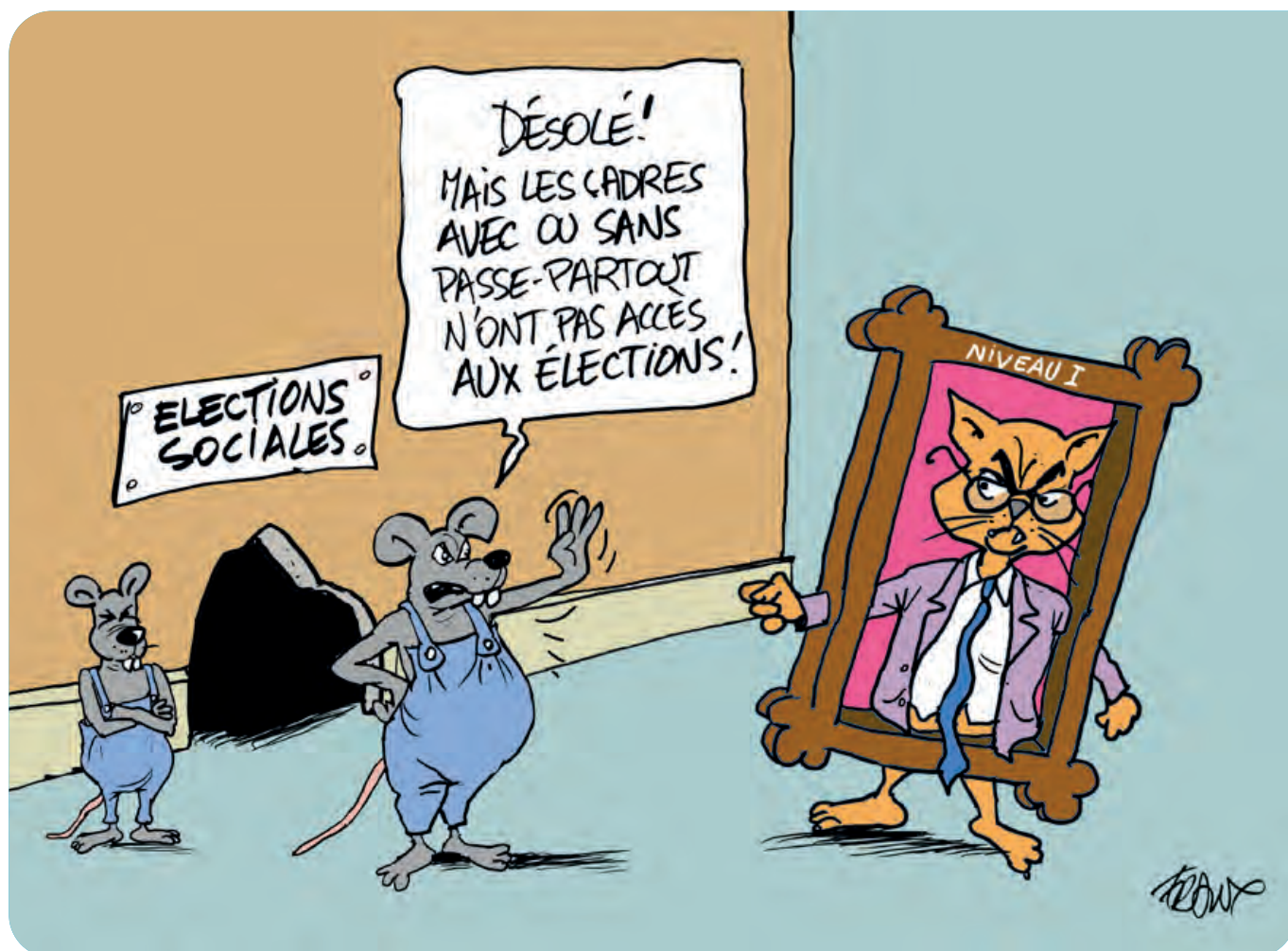
figure dans l'AR en application de la législation du travail sur le personnel cadre ou fiduciaire ( Tribunal du travail de Bruxelles (Fr) 12.02.2020, AR 20/401 ).

L'indication du caractère managérial ou non d'une fonction doit se faire au niveau de l'unité technique d'exploitation ( Tribunal du travail d'Anvers, division d'Anvers 11.03.2020, AR 20/583/A et 20/584/A ). Étant donné que la définition de l'unité technique d'exploitation peut être différente pour le Conseil d'entreprise et le CPPT, la liste du personnel de direction peut donc également être différente pour ces deux organes ( Tribunal du travail de Bruxelles (Fr) 05.02.2020, AR 20/316A et 20/317/A ).