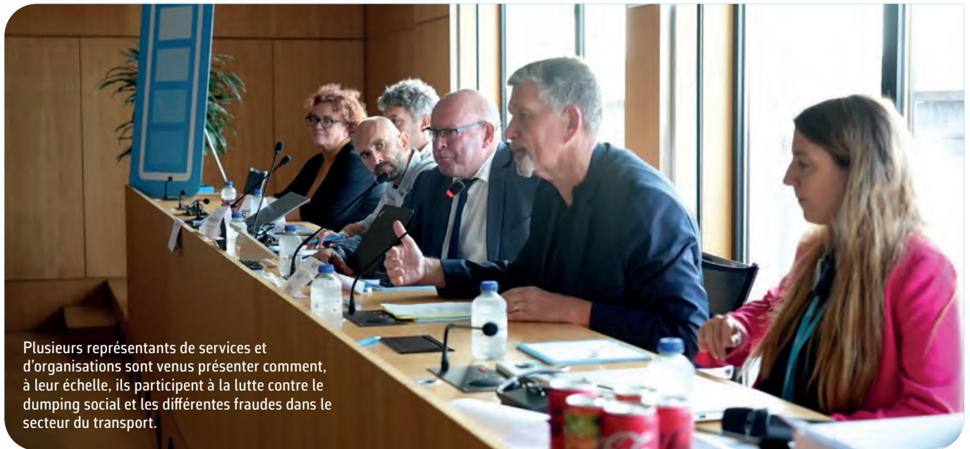
Plusieurs représentants de services et d'organisations sont venus présenter comment, à leur échelle, ils participent à la lutte contre le dumping social et les différentes fraudes dans le secteur du transport.

règle soit suivie, encore faut-il que le chauffeur en ait connaissance, d'où la nécessité des campagnes de communication comme en réalise ELA.