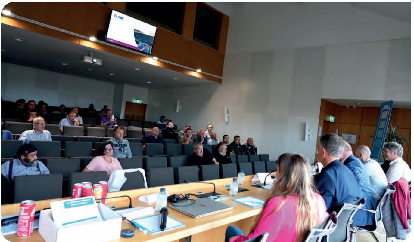
Une quarantaine de travailleurs du secteur du transport ont participé à une journée d'étude organisée par le service secteurs de la CGSLB.

Une journée d'étude consacrée à la lutte contre la fraude et le dumping social dans le transport a été organisée par la CGSLB. Plusieurs acteurs du secteur ont expliqué leur rôle dans ce combat qui nécessite une étroite coopération entre plusieurs services, tant au niveau national qu'international.