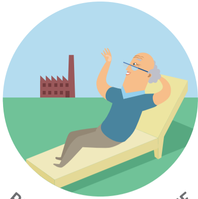
PENSIONS DE RETRAITE