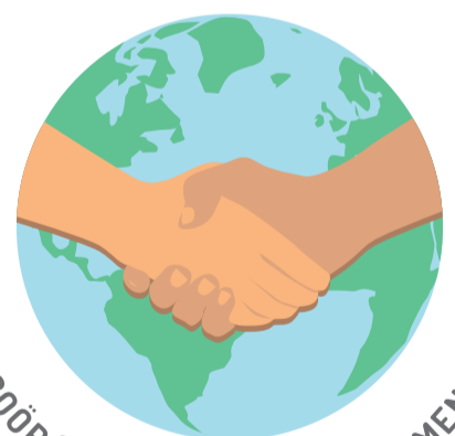
COOPÉRATION AU DÉVELOPPEMENT