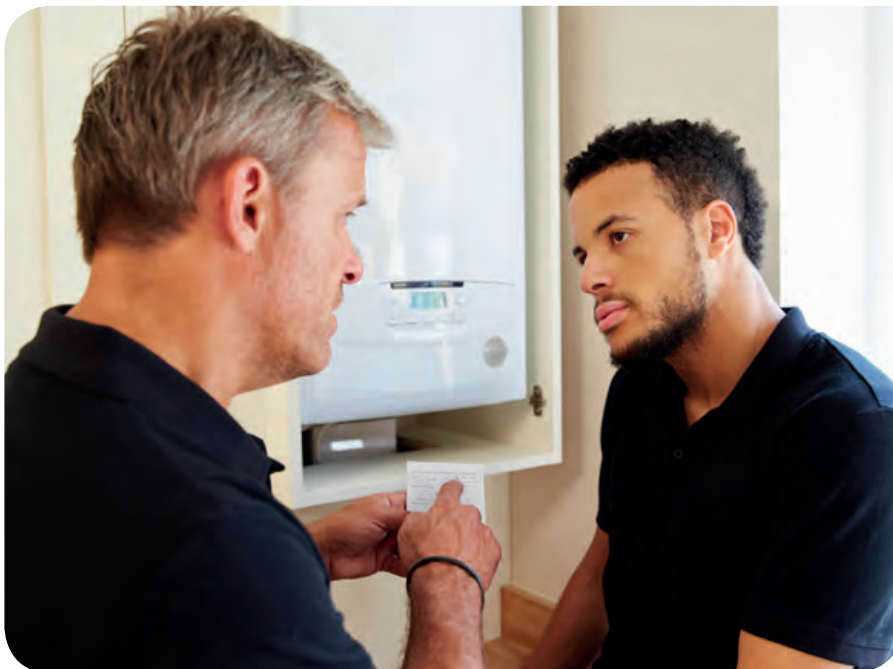
Et si je change ma vieille chaudière à mazout pour un modèle plus performant et plus propre, ai-je droit à une prime ?

Votre famille s'agrandit ? Vous allez acheter votre maison ? Vous prévoyez des travaux de rénovation ? Il existe de nombreuses primes et interventions, mais encore faut-il savoir où les demander ! Ne vous inquiétez pas, nous sommes là pour vous soutenir dans vos démarches.