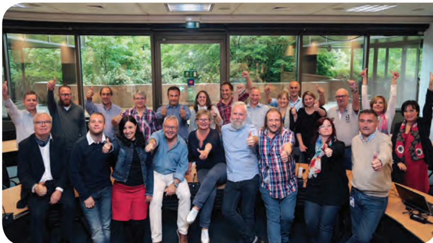
En augmentant le nombre de mandats, les délégués d'AXA ont récolté les fruits de leur travail lors des élections sociales de mai 2016.

Parce qu'ils ou elles ne supportent pas l'injustice, parce qu'ils ou elles estiment que le personnel a aussi son mot à dire dans la marche de l'entreprise, des volontaires se présentent aux élections sociales ou revendiquent un mandat en délégation syndicale. Ils et elles portent votre parole auprès de la direction et défendent vos intérêts collectifs et individuels.