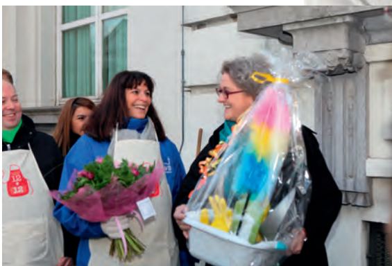
Ratificatie van het IAO-verdrag C189 voor 'Domestic Workers' - 2013