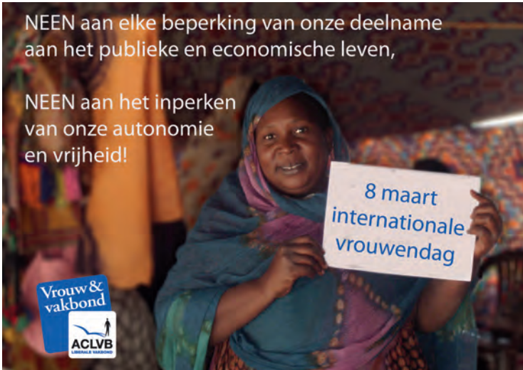
Internationale Vrouwendag - 2012