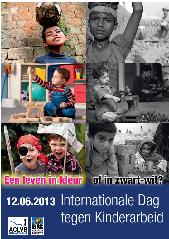
Internationale Dag tegen de Kinderarbeid 2013