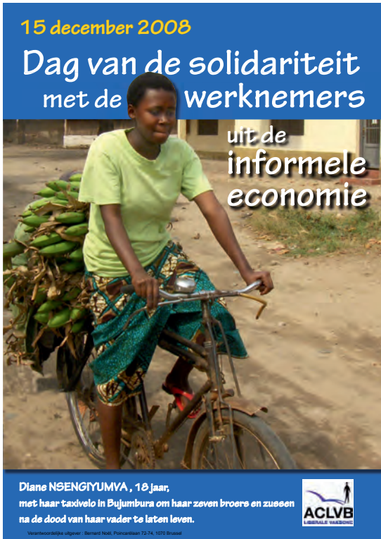
Dag van de Informele Economie 2008