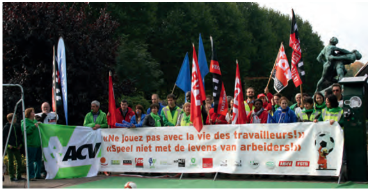
Actie Waardig Werk IVV- WK Qatar - 2013