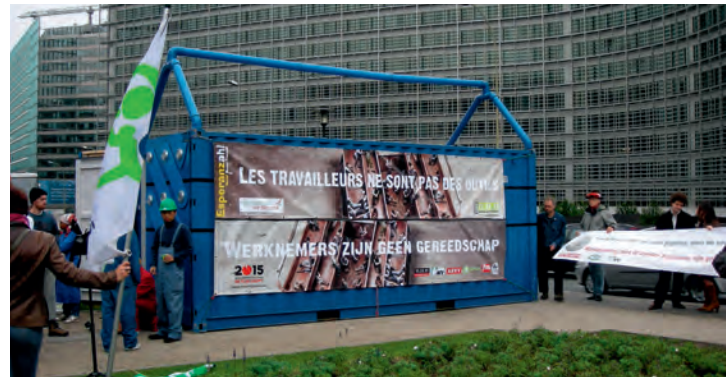
Actie Waardig Werk IVV - 2008