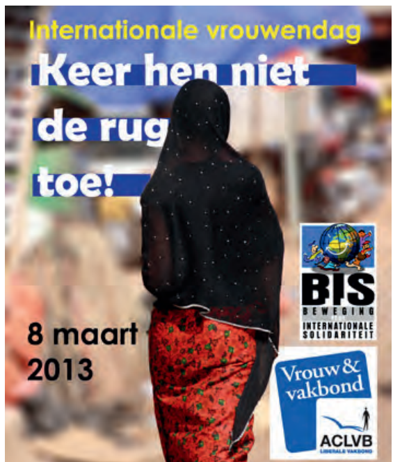
Internationale Vrouwendag - 2013