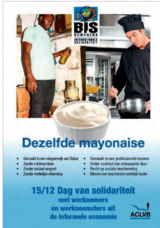
Dag van de Informele Economie 2014