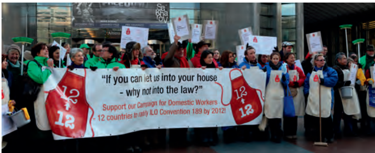
Actie Domestic Workers - EU Parlement - 2011