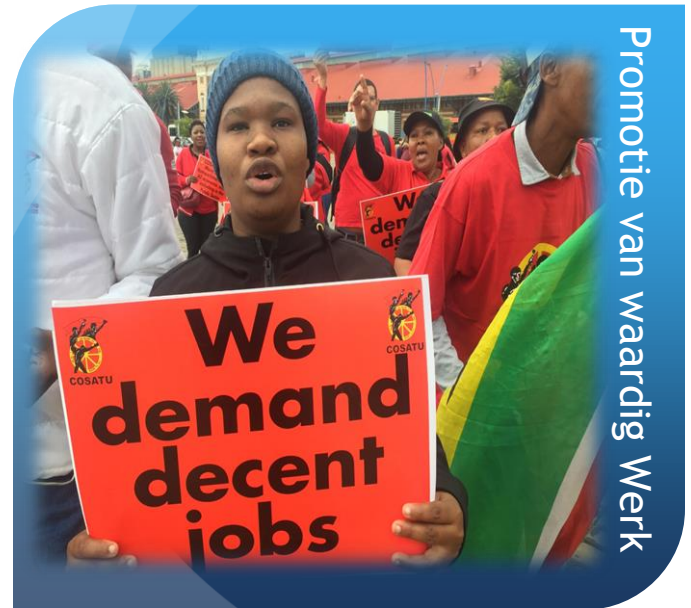
Promotie van waardig Werk

De nood aan een nationaal minimumloon is hoger dan ooit. Na strijd vanaf het ontstaan van COSATU in 1985 heeft het Zuid-Afrikaanse parlement eind 2018 een wetsontwerp aangenomen om vanaf 1/1/2019 een minimumloon van 3500 rand per maand (235 euro) in de nationale wetgeving vast te leggen!! Dit is een zeer grote overwinning voor de vakbonden!