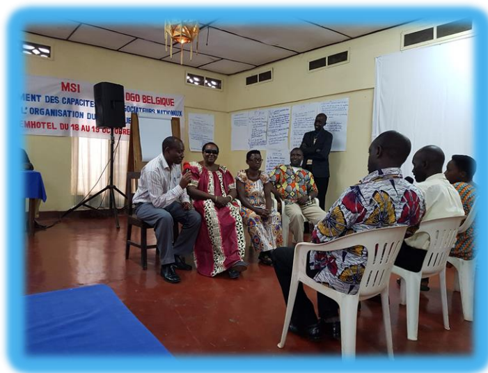
Atelier de renforcement de capacités, Bujumbura

l'intention des responsables locaux, des affiliés et des travailleurs non-organisés ont pu être organisés dans les chefs-lieux de toutes les provinces du Burundi.